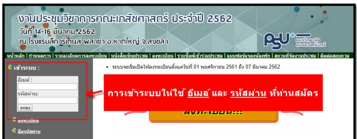
ภาพประกอบที่ 5